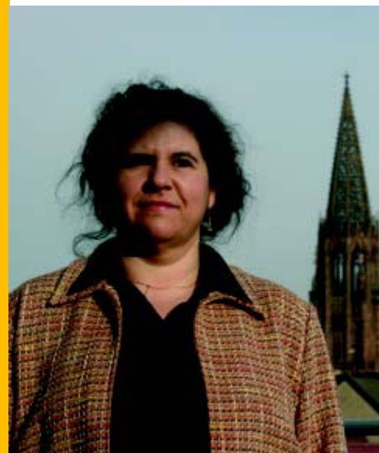
És una infatigable propagandista de la cultura catalana.

“Intento motivar la gent, tant per Internet com de tu a tu”