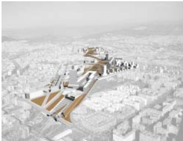
Imatge virtual de l'estació de la Sagrera

En aquest marc, s'acordà crear una Societat per al desenvolupament de les actuacions a executar en l'àmbit Sant Andreu – Sagrera. La Societat es va constituir formalment el 27 de juny de 2003, davant notari.