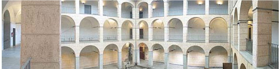
Claustre de l'Hospici d'Olot, seu tècnica de l'Observatori del Paisatge

L'Observatori del Paisatge té la seu tècnica a Olot i la seu social al Departament de Política Territorial i Obres Públiques de la Generalitat de Catalunya.